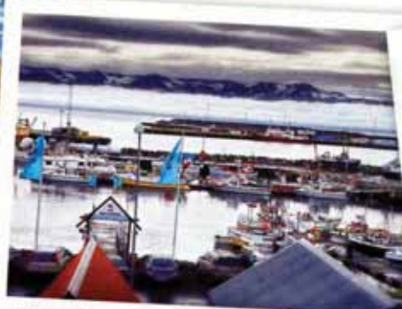
Húsavík, 2500 habitants, est un charmant petit port de la mer du Groenland. La vie économique du village, comme en Islande plus généralement d'ailleurs, tourne largement autour de la pêche.