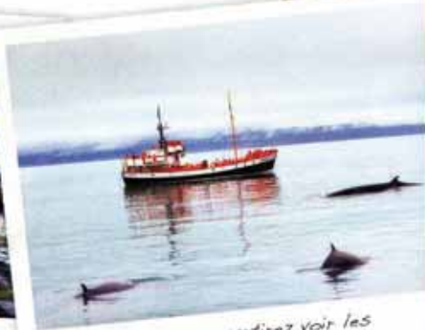
De ce port vous partirez voir les baleines tôt le matin pour une sortie de 3 h environ. Penser à réserver en juillet.